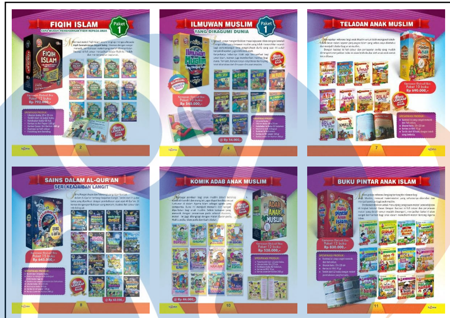
Gambar 2. 2 Katalog PT Luxima Metro Media

Pada saat ini Penerbit Luxima total telah menerbitkan sebanyak 302 buku yang dikemas ke dalam paket seri sejumlah 19 paket serta sebagian buku satuan. Berikut merupakan ilustrasi dari sebagian buku yang diterbitkan: