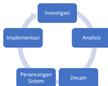
Gambar 3. 1 Tahapan Penelitian

Pada penelitian ini dilakukan menjadi 5 tahap yaitu investigasi, analisis, desain, perancangan system, dan terakhir Implementasi. Proses utama dan detail tahapan penelitian seperti diperlihatkan oleh Gambar dibawah ini