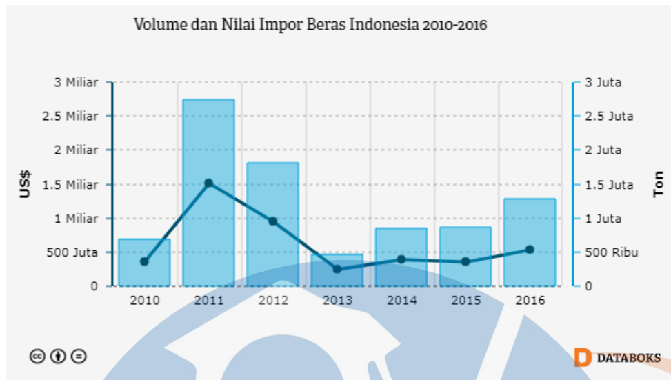
Gambar 3 Grafik Harga Beras

http://katadata.co.id/public/media/chart_thumbnail/107291-berapa-impor-beras-indonesia.png?updated=1500570000