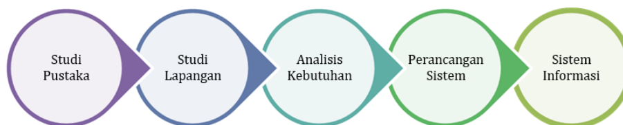
Gambar 3. 2 Alur Metode Analisis

Pada gambar di bawah ini, menggambarkan rancangan analisis penelitian dari penulis yang berguna untuk mencapai tujuan yang telah direncanakan sebelumnya. Dari mulai studi pustaka sampai tahap akhir penelitian.